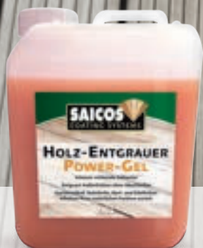
Holz-Entgrauer Power-Gel entgraut Außenholz ohne Abschleifen

besonders empfohlen für vertikale Flächen (z. B. Zäune, Sichtblenden...)